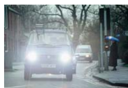
■ワイドダイナミックOFF時の映像