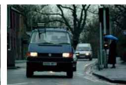
■ワイドダイナミックON時の映像

自動車のヘッドライト、太陽光、蛍光灯等による光のハレーションを抑え、見やすい映像に補正します。