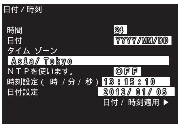
日付 / 時刻設定画面